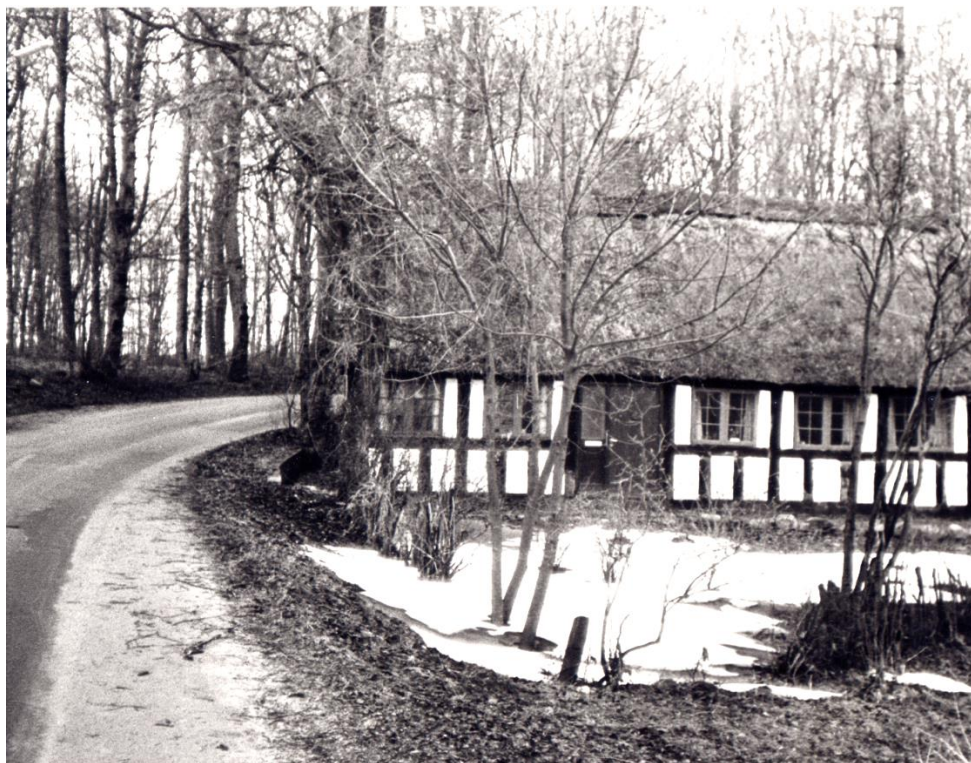
Skovhuset, Fregerslevvej 35. (B147)