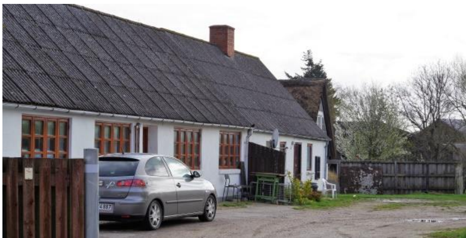
Stjærvej 21, 2017.