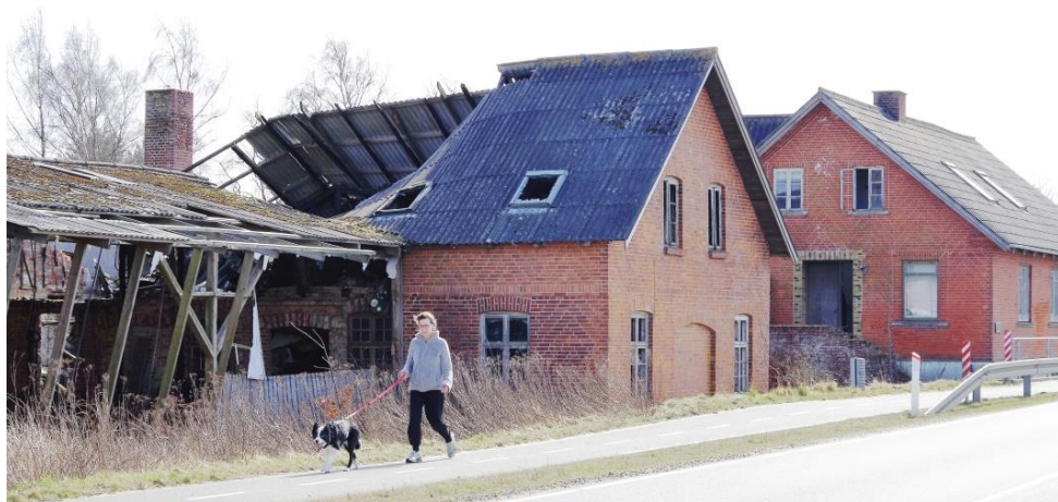
En del af resterne af "savværksbyen" ved Låsbyvej 60, fotograferet i 2017 af Erna Bachmann (F2251 og F2254)