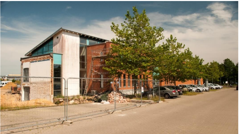
Juni 2019. Det gamle rådhus nedrevet for at give plads til etageboliger mm.