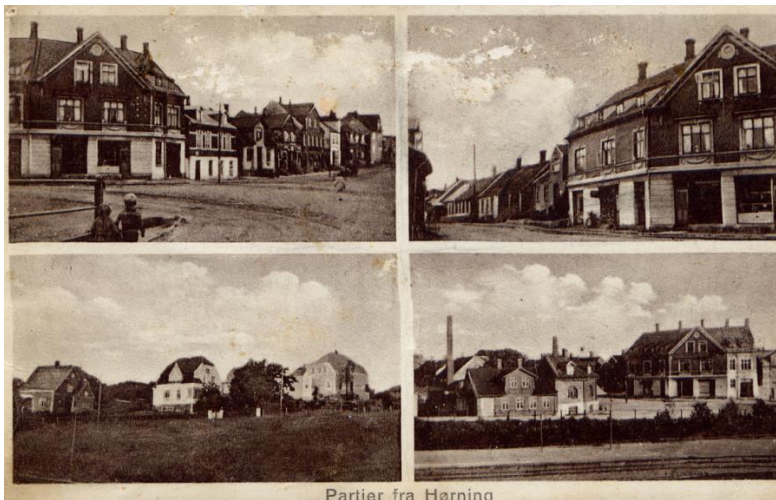
Partier fra Høring

Hjørnet Fregerslevvej/Blegindvej 1930. Øverst til venstre: