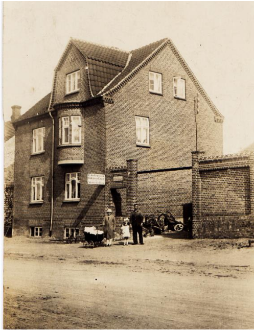
Smedeværksted Fregerslevvej 13, Hørning. 1928 (B309).