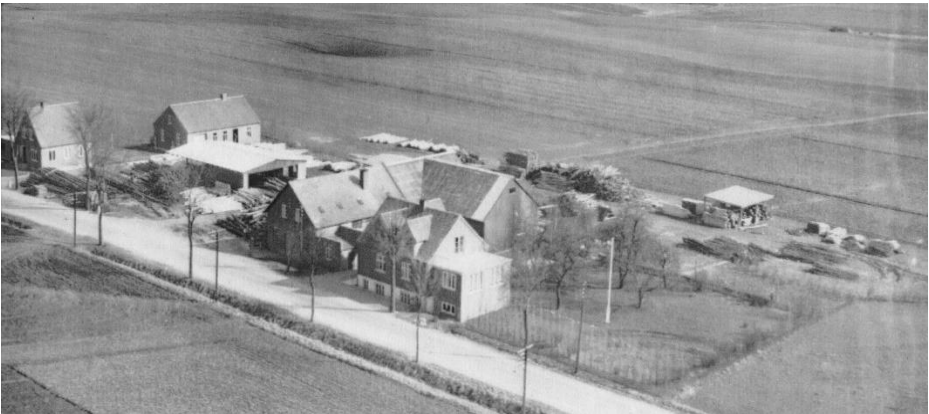
Hårby Savværk 1950

Han slutter interviewet af med; ”Jeg synes, det går godt i øjeblikket, og kan jeg blot blive ved med at holde savværket i gang i den størrelse, det har nu, er jeg tilfreds. Det skal ikke arbejdes op til at være alt for stort”.