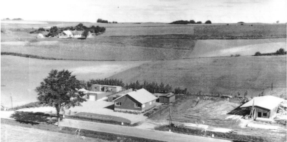
Låsbyvej 106 – 1950.