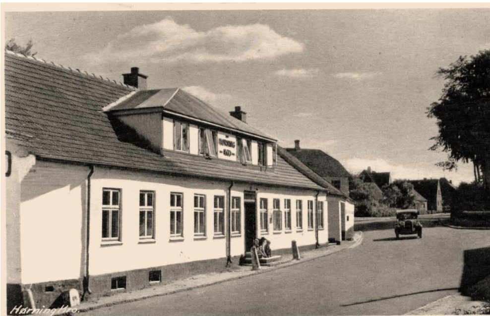
Århusvej 4, Hørning Kro mellem 1940 og 1953. I 1953 blev bygningerne revet ned for at give plads til ændret linjeføring af hovedvejen. (B101).