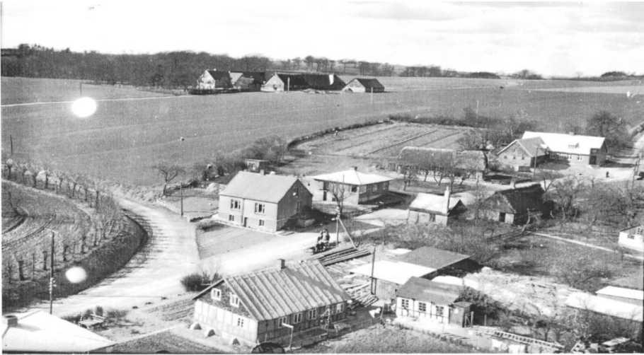
Vidkærvej 20 – 1950.