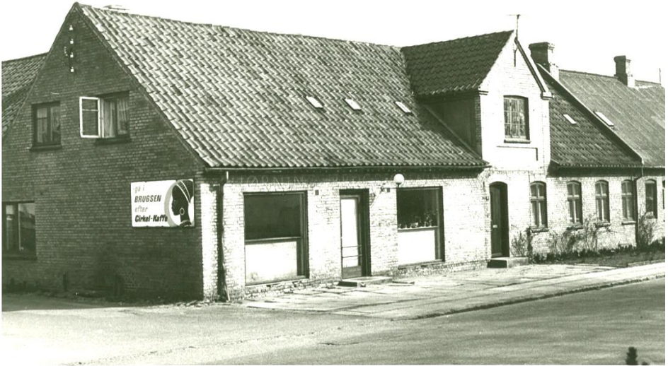
Vestervej 12, Hørning. Fra 1860-1916 Skole, fra 1916-1966 Hørning Brugsforening, derefter nedrevet for at give plads til nyt rådhus og bibliotek. (B426)