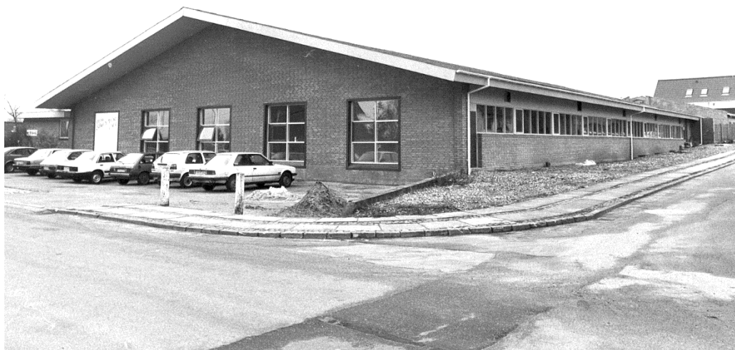
Kildevej 6, Hørning. 1989. Har huset bl.a.Squashcenter og Hummel, senere ombygget til 16 ejerlejligheder. (B1629).