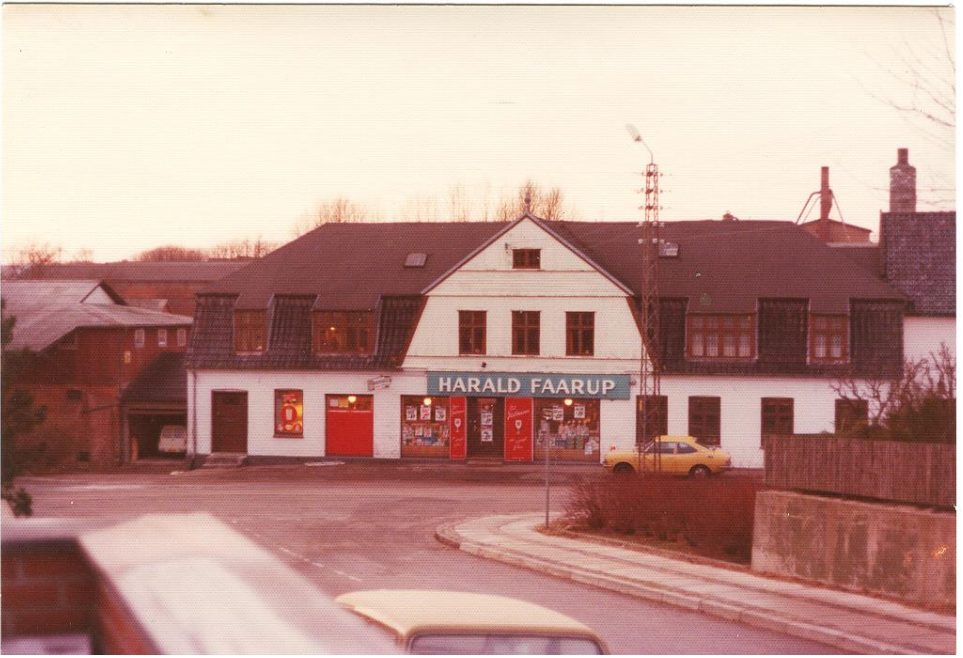
Fregerslevvej 2 , ca 1979. I 1983 blev bygningen ombygget til ejerlejligheder (B189).