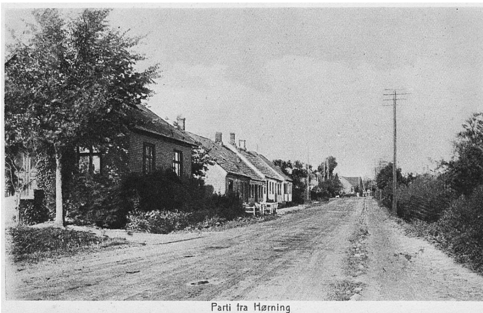
Parti fra Hørning