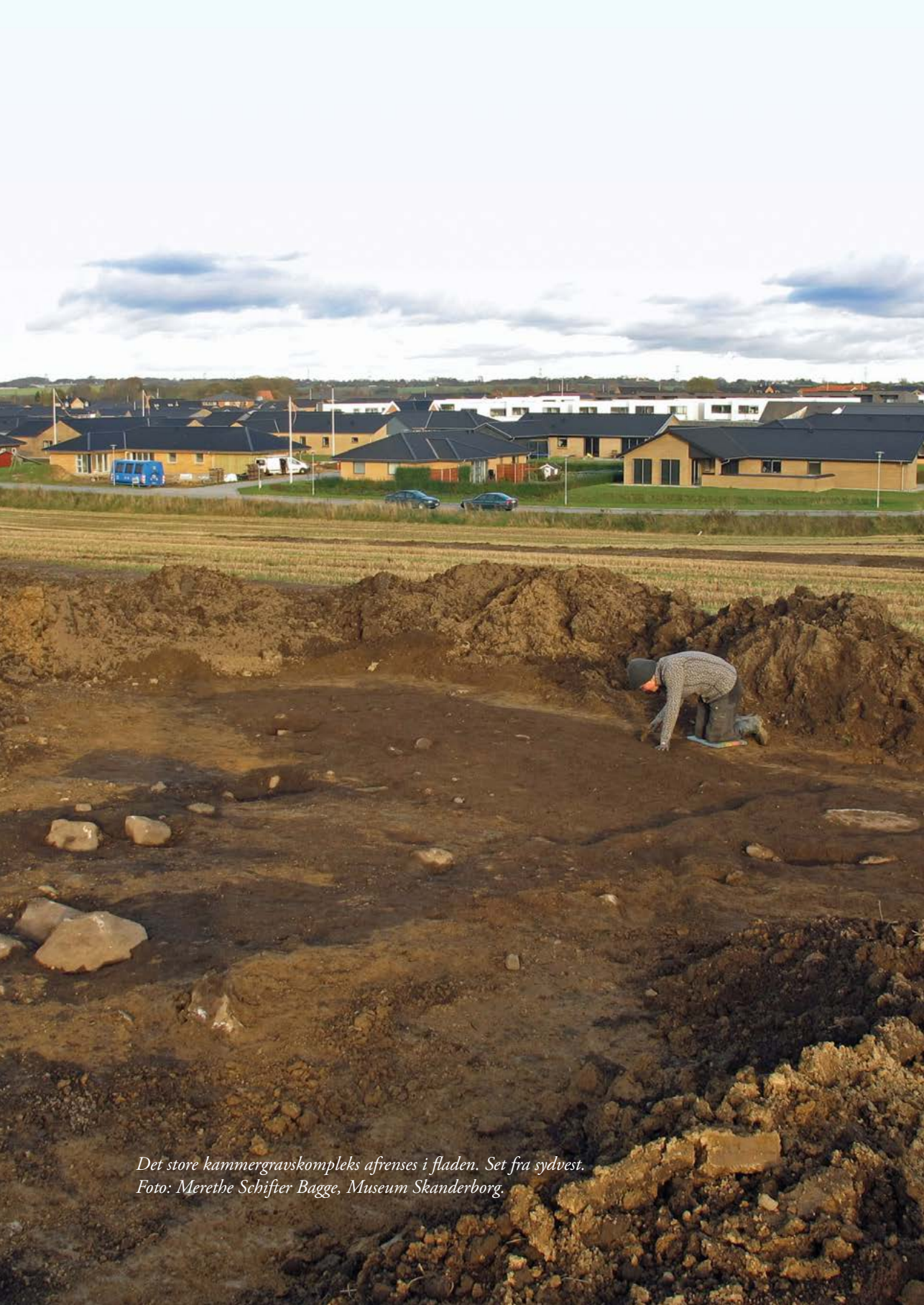
Det store kammergravskompleks afrensning i fladen. Set fra sydvest.