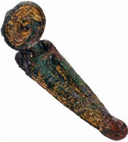
Her ses et af de toledede stykker rasleblæk, som har pyntet på seletøjet. Stykket er lavet af forgyldt bronze.

Sidst, men ikke mindst, også et fornemt bidsel med parérstænger og kindplader.