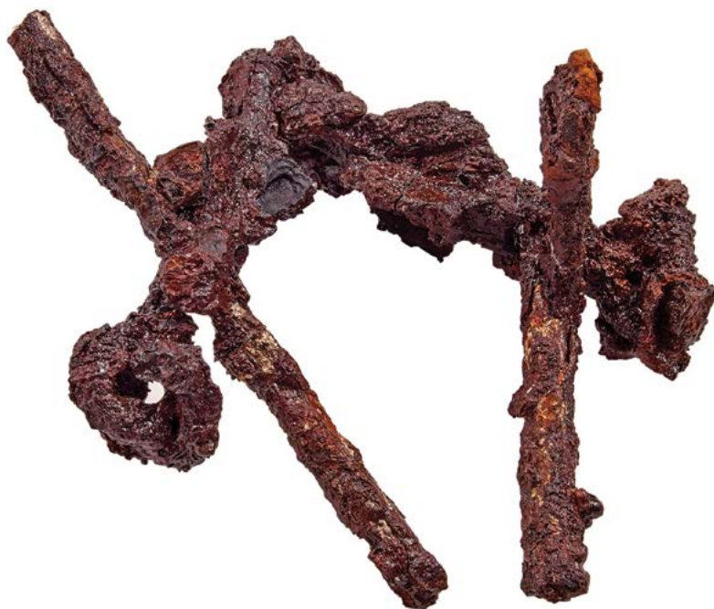
Bidslet med parørstænger af sølvbelagt jern. Der hører ligeledes kindplader til af sølvbelagt jern, men grundet deres ringe stand kan de ikke sættes på bidslet.

Selvom vi endnu ikke kender det fulde indhold af Fregerslev-groavene, så ved vi allerede nu, at fundet er af stor betydning for tolkningen af elitebegravelser i 900-tallet. Der kendes flere ryttergroave fra vikingetiden i Danmark og Slesvig, men kun et fåtal er sagligt udgrovet. I de gamle og usagkyndigt, udgrovede fund, findes mange større pragt-