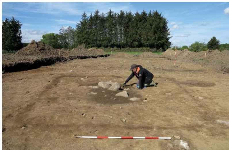
Her ses graven med den smalle grøft omkring, der enten har dannet en form for hegn eller en mindre bygning. Set fra øst.

Omkring graven var der anlagt enten et hegn eller en mindre bygning. Det er meget usædvanligt at finde konstruktioner omkring gravene i vikingetiden, men det er dog set i et par tilfælde. Med et knækket skinneben, to lag kampesten henover sig samt en mulig indhegning om graven, må vi opfatte den afdøde som en særlig person – altså én, som helt bestemt ikke skulle rejse sig fra graven!