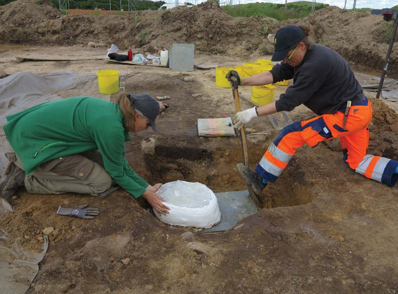
Optagning af jordklumpen med metaller.

stande, der lå under løsdelen af seletøjet, blev vurderet som meget udsatte ved en bevaring på stedet. Derfor blev en større jordklump taget op i dette område.